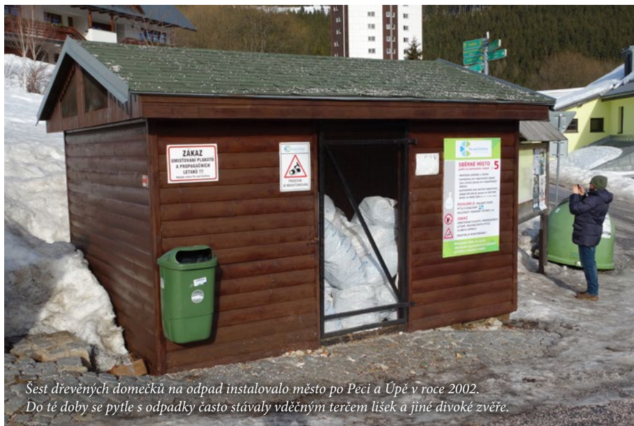
Šest dřevěných domečků na odpad instalovalo město po Peci a Úpě v roce 2002. Do té doby se pytle s odpadky často stávaly vděčným terčem lišek a jiné divoké zvěře.

Znamená to, že na jednu domácnost (byt, rodinný dům, objekt rodinné rekreace apod.) připadne jedna nádoba na odpad (popelnice) nebo zvolený počet pytlů. Četnost vývozu popelnic (v případě pytlů je vhodnější pojem likvidace) si každá domácnost či vlastník nemovitosti vybere dle