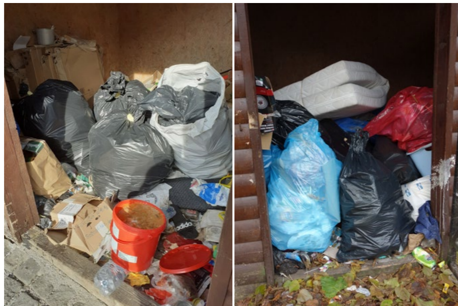
Město se dlouhodobě potýkalo s tím, že do domečků lidé odkládali odpad, který nebyl v bílých označených pytlích. Za ten pak vždy muselo doplácet.